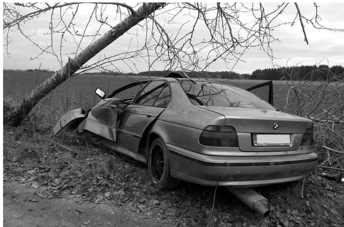
BMW spidometro rodyklė užstrigusi ties 150 km./h greičiu.

Šeštadienį, apie 15 valandą, Karčių kaimo (Troškūnų sen.) žvyrkeliu beprotišku greičiu lėkęs BMW rėžėsi į pakelės medį. Automobilį vairavęs 27-erių metų P.G. žuvo vietoje. BMW spidometro rodyklė užstrigusi ties 150 km/h greičiu. Vyras važiavo vienas.