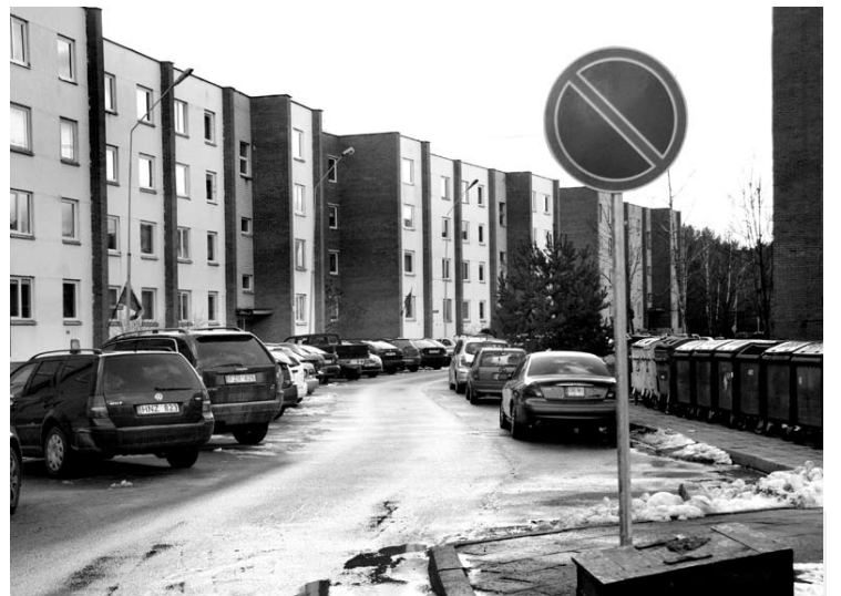
Pušyno mikrorajono Storių gatvės gyventojai neturėdami kur palikti automobilį, žiemą nepaisydavo kelio ženklo „Stovėti draudžiama“.