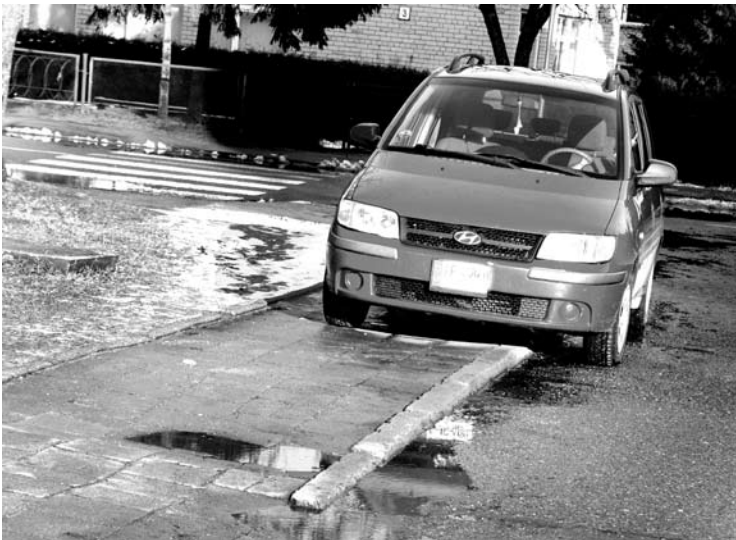
Šis Ramybės mikrorajone ant šaligatvio paliktas automobilis į nevirtį varo akluosius.

Per kelis dešimtmečius keliskart padaugėjus automobilių, jų parkavimui liko tos pačios sovietmečiu suprojektuotos ir įrengtos aikštelės.